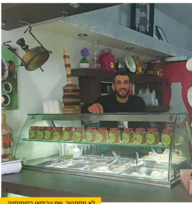
לא מסתנוור. שף עביסאן בחומוסייה

"לעסק יותר קל בתל אביב, הקהל יותר זורם, פחות קשוח. יוצא גם בתקופות יותר קשות ומוכן לשלם מחירים גבוהים על חומוס טוב. אבל כבעל משפחה אני לא רוצה לחיות שם. אני מאמין בחינוך הירו שלמי ובאווירה כאן. חוץ מזה, הכל יקר שם מדי. לא הייתי יכול לקנות אפילו אצלי..."