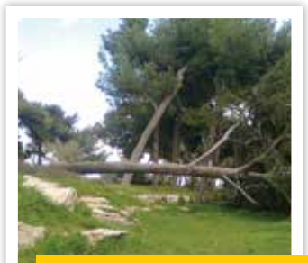
כריתה אכזרית. טיילת בר כוכבא

לקראת החורף, בשל הימצאות של קווי חשמל במקום. לאחר סיור במקום עם נציגי חברת החשמל, האגרונום העירוני ומנהל האזור – סומנו העצים לגיזום ולעקירה בהתאם להנחיות ולהמלצות של הגורמים המקצועיים. העבודה בוצעה בהתאם לאישורים שניתנו, ולא מעבר לכך.