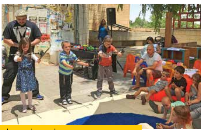
דור העתיד בגבעה: יחד, עם ובלי כיפות לראשי הילדים

שמעתי, ראיתי, הייתי בסרט הזה. בית הספר של שנות ילדותי בשכונת מקור ברוך - בית ספר "לילדי פועלים" על שם ברל כצנלסון - הוא עתה ישיבה. בכל פינה בבירה תמצא